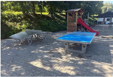
SV Neufraunhofen- Tischtennisplatten