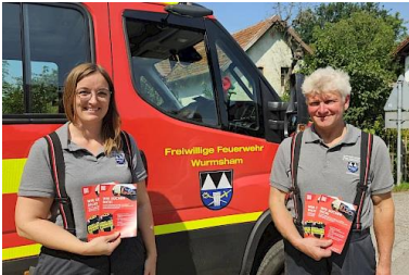
FFW Wurmsham- Kampagne