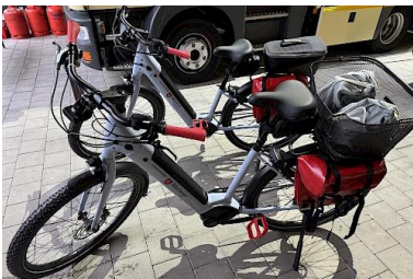
Malteser Velden- Einsatz E-Bikes