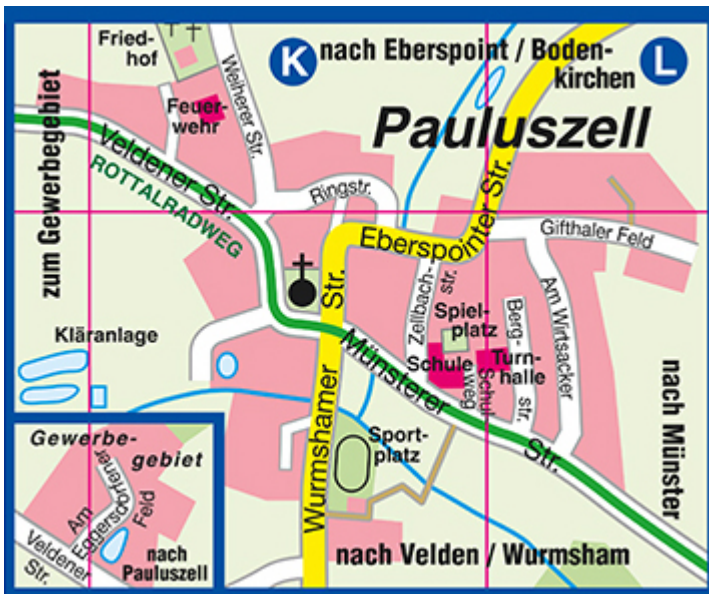
Ortsplan der Gemeinde Pauluszell, © REBA-Verlag Freising, 2018