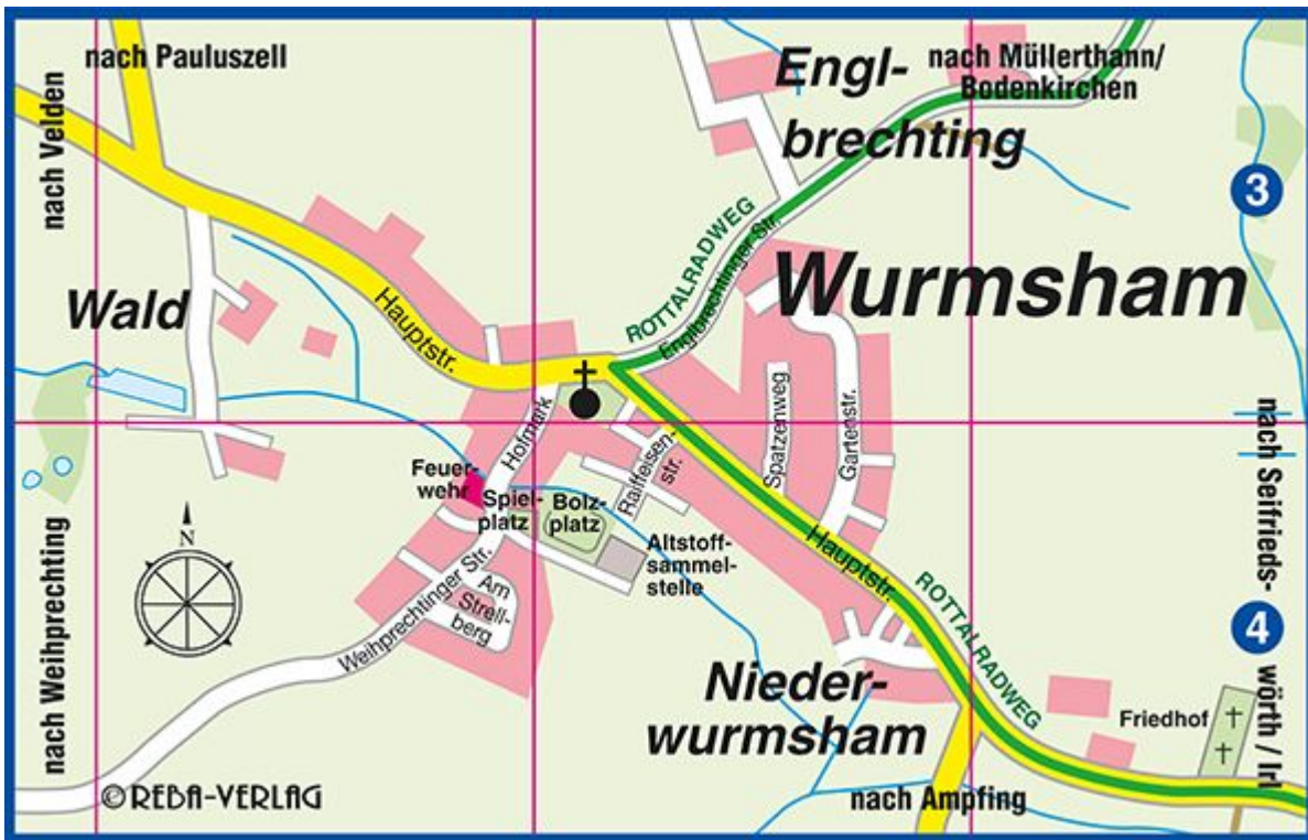
Ortsplan Gemeinde Wurmsham, © REBA-Verlag Freising, 2018